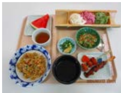
スタミナにんにく 肉炒飯