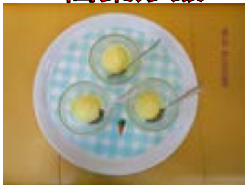
パイン味 アイスクリーム