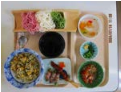
胡麻香るちりめん 高菜炒飯