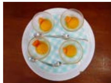
マンゴー味 アイスクリーム