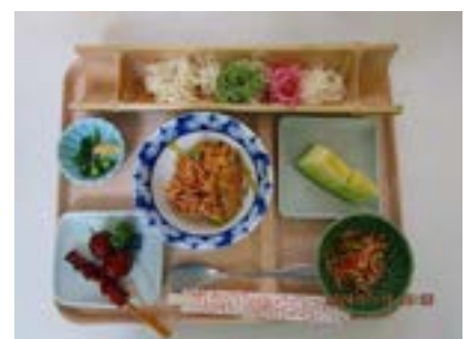
鮭と大葉の爽やか 和風炒飯