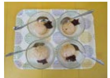
黒糖味 アイスクリーム